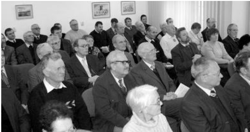
A kolozsvári presbiter-találkozó résztvevői