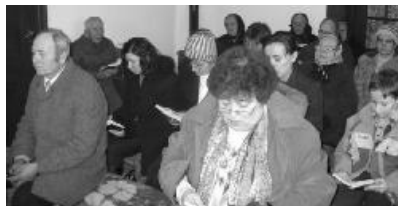
A tamashidai imahét résztvevői