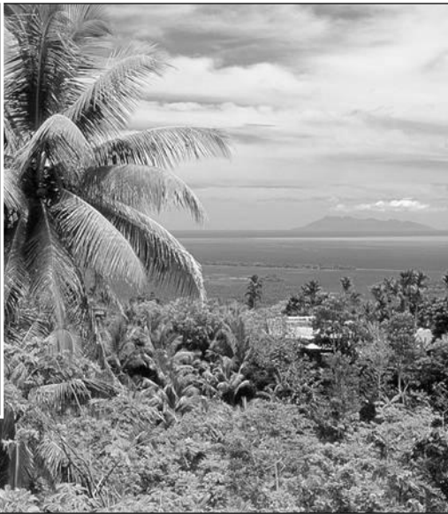
Az idei női imanap témáját a pápua új-guineai nők készítették. Képünkön új-guineai tájkép és az imanap hivatalos plakátja

A keresztyén asszonyok világot átfogó imamozgalmában sok hagyomány, vallás találkozik. Több mint 170 ország asszonyai kapcsolódnak be a minden év márciusának első péntekjén megrendezésre kerülő mozgalomba, mely 1887-ben indult el útjára az Egyesült Államokból.